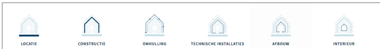
Afbeelding 2: Gebouwschillen in Madaster

De in het gebouw toegepaste materialen en producten worden in het Madaster platform gecategoriseerd en toegewezen aan verschillende gebouwschillen. Op deze wijze wordt ook de locatie in het gebouw inzichtelijk waar materialen en producten zich bevinden. Naast bouwkundige en constructieve elementen heeft Madaster ook de mogelijkheid om technische installaties, interieur en elementen in de nabije omgeving van het gebouw te classificeren. Afhankelijk van de doelstellingen van Opdrachtgever wordt bepaald van welke gebouwschillen een materialenpaspoort wordt verwacht, hetgeen uiteindelijk resulteert in één Gebouwpaspoort.