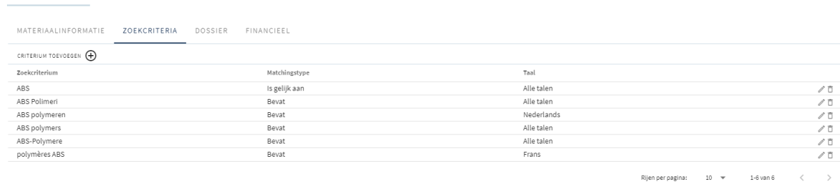
Fig: Eksempel på søkekriterier for materialer eller produkter i Madaster

Når du importerer en IFC-fil, blir materialene til hvert element tilordnet til disse søkekriteriene. Dette omfatter å sjekke om materialet til et element samsvarer med et av søkekriteriene på produkt- eller materialnivå på de valgte språkene.