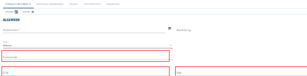
Fig: Eksempel på tilordning til produkt-, GTIN og EAN-kode

Så snart materialene for et element er kjent, blir de under dataopplastingen til Madaster automatisk tilordnet (koblet) til kjente materialer og produkter i Madaster-databasen(e). Du finner disse i Madaster-navigasjonsskuffen under «Systemdatabaser og leverandører». Eventuelle tilgjengelige kontospesifikke databaser kan også velges i denne importprosessen.